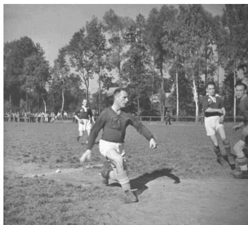
Fotbalové utkání mužstev SK Litomyšl a SK Parník