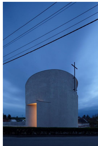
Kostel sv. Václava v Sazovicích

„Jsem architekt a hmota a její dotek je pro mne prostředkem tvoření a zkoumání. Dotekem se hmoty uvádějí v pohyb, mění se jejich energie, jsou na začátku chemické reakce. Dotek každé dvojice je známkou napětí. Nejznámějším dotekem v umění je Michelangelovo stvoření Adama, kdy ukazováčky obou postav – Boha Otce a Adama – jsou v poloze přesně před setkáním. Velmi intenzivní přicházející krátký okamžik, ve kterém Adam dostane život.“