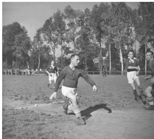
Fotbalové utkání mužstev SK Litomyšl a SK Parník