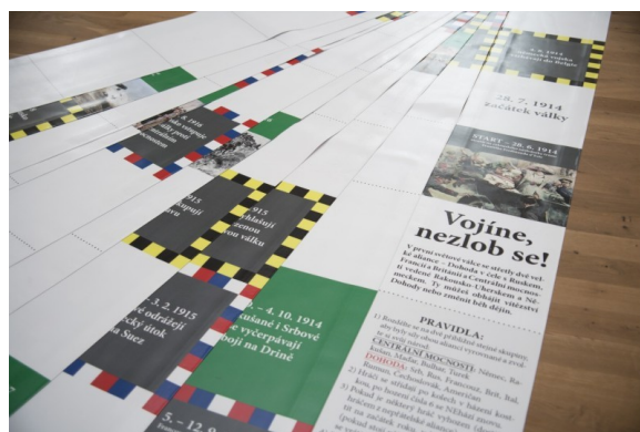
Hra Vojine, nezlob se v „životní“ velikosti

Prohlídku výstavy je možné spojit i se speciální dílnou – odléváním peněz z čokolády – hlásit se můžete telefonicky na čísle 461 611 162 (Renata Kmošková) nebo e-mailem na adresu kmoskova@rml.cz . Dílna bude probíhat i během 4. adventní neděle (20. prosince 2015) – více viz příslušná aktualita.