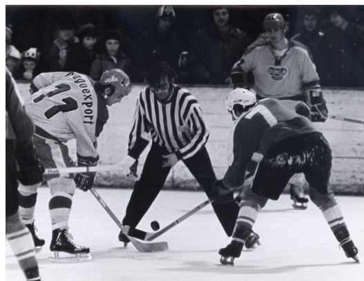
Zápas Litomyšl – Dukla v roce 1978

úterý 23. února – exhibice 9.00–12.00 hodin středa 24. února – výměna hokejových kartiček pro děti 9.00–12.00 hodin čtvrtek 25. února – exhibice 13.00–17.00 hodin sobota 27. února – burza a výměna hokejových kartiček nejen pro sběratele 13.00–17.00 hodin