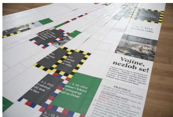
Hra Vojne, nezlob se v „životní“ velikosti

Prohlídku výstavy je možné spojit i se speciální dílnou – odléváním peněz z čokolády – hlásit se můžete telefonicky na čísle 461 611 162 (Renata Kmošková) nebo e-mailem na adresu kmoskova@rml.cz . Dílna bude probíhat i během 4. adventní neděle (20. prosince 2015) – více viz příslušná aktualita.