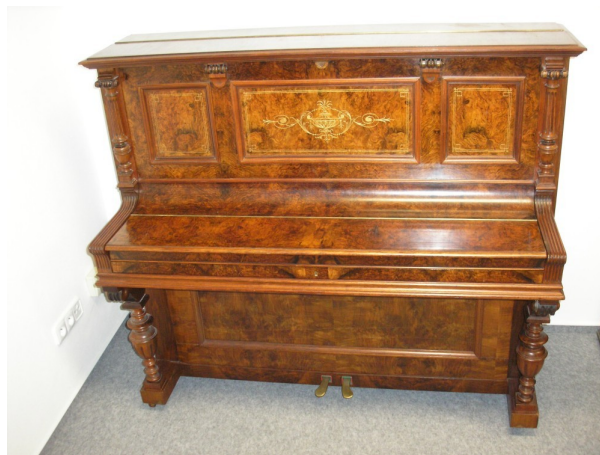
Pianino Rudolf Kotík staré 110 let