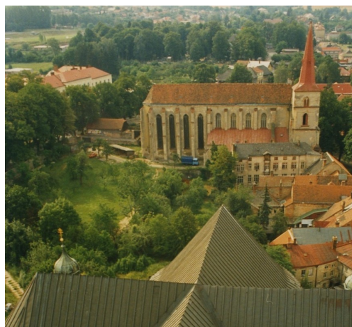
Původní stav prostoru budoucích Klášterních zahrad v 90. letech 20. století.

Vernisáž výstavy se uskuteční v muzeu v pátek 2. října 2015 v 17.00 hodin.