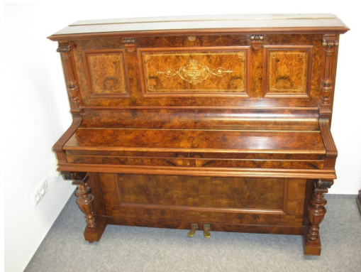
Pianino Rudolf Kotík staré 110 let