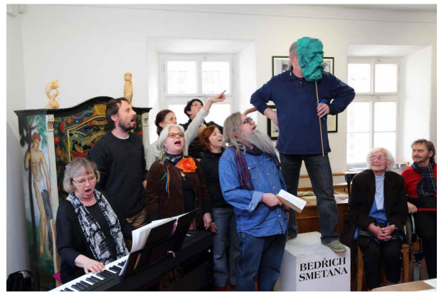
Divadelní spolek Filigrán při přednesu části opery Krvavý román