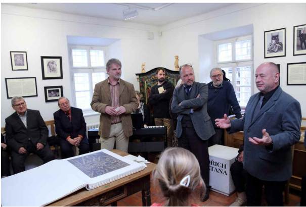
Vpravo ředitel Památníku národního písemnictví Zdeněk Freisleben