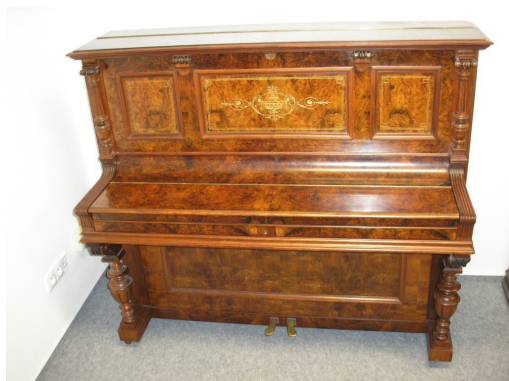
Pianino Rudolf Kotík staré 110 let