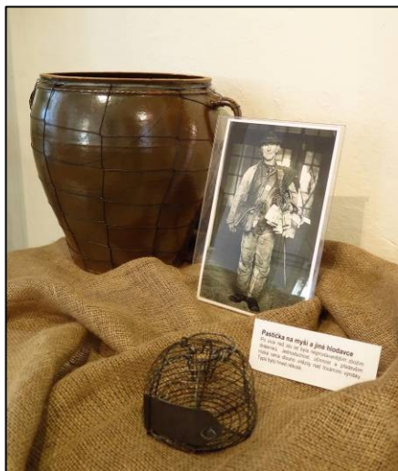
Pastička na myši

Velký výstavní sál Regionálního muzea v Litomyšli zaplnily nejen výrobky novodobých dráteníků, ale i ukázky tradičních prací slovenských dráteníků, kteří během 19. století a v 1. třetině 20. století putovali (vyjma Austrálie) po celém světě, opravovali prasklé staré nádoby, drátovали nové a prodávali své výrobky. Z muzejních sbírek jsou vystavené drátované nádoby, na nichž si návštěvníci mohou všimnout, že při opravách estetické hledisko skutečně nehrálo roli, důležitá byla funkčnost nádoby. Vystavena je mísa z žitavské fajánse z roku 1724, pocházející pravděpodobně z litomyšlské piaristické koleje, která dokládá opravu drátem technikou heftování. Tento způsob zpevňování prasklých nádob byl známý už v pravěku, což dokládají prezentované archeologické nálezy. K vidění jsou nálezy různých typů spon a záušnic, dokládající užití drátu na špercích. Nesmí chybět pastička na myši, suverénně nejprodávanější výrobek dráteníků. Jejich cenám ve své době nemohla konkurovat ani tovární výroba.