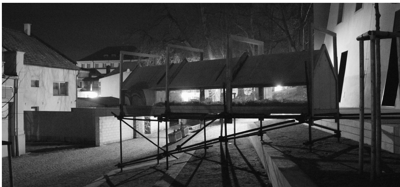
Součástí výstavy Šárka Hrouzková a její žáci je exteriérová instalace na terasách Regionálního muzea v Litomyšli: