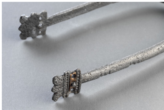
ostruha z Benátek

Návštěvníci se mohou těšit např. na slavnou maskovitou sponu z Mikulovic, meč ze Žampachu, zlatý poklad ze Srchu, fragment čínské čajové misky dynastie Ming z Chrudimi nebo ostruhu s ploténkami z hradiska v Benátkách.