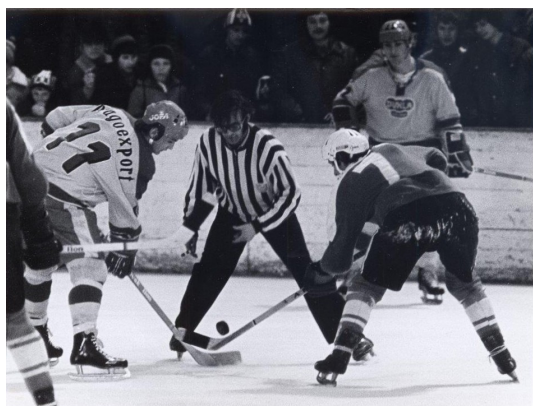
Zápas Litomyšl – Dukla v roce 1978