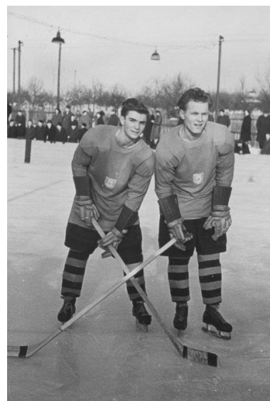
Litomyšlští hokejisté v roce 1956

Po celou dobu trvání výstavy je připraven doprovodný program . Můžete si např. vyzkoušet hokejovou výstroj, trénink „na suchu“, zahrát stiga hokej, shlédnout krátké filmy z historie hokeje a mnoho dalšího.