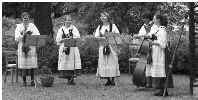
Folklórní soubor Heblata

Vstupné: žáci mateřských škol 10 Kč; žáci a studenti škol s předplacenou permanentkou 20 Kč pouze za materiál; žáci a studenti škol bez předplacené permanentky 40 Kč; učitelé zdarma; v ceně programu je zahrnut materiál na tvoření, návštěva výstavy a lektor