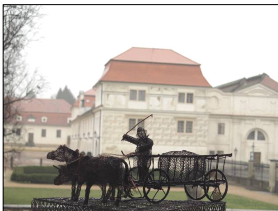
Vůz s koňmi od Ladislava Šlechty

Abychom ušetřili Vaše peníze na případný nákup drátovaných předmětů, bude tento den vstup do muzea od 13 do 17 hodin zdarma .