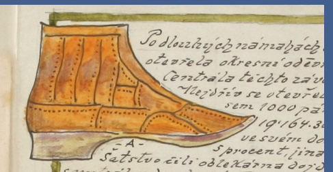
Boty: cena 4Q / načerno 8Q