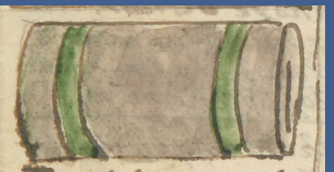
Plátno: cena 3Q / načerno 6Q