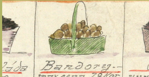
Brambory: cena 3Q / načerno 6Q