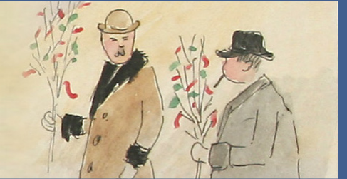
Kožich: cena 5Q / načerno 10Q