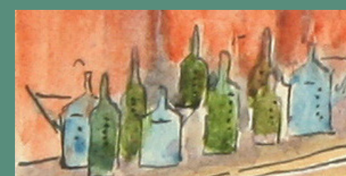
Petrolej: cena 6Q / načerno 12Q