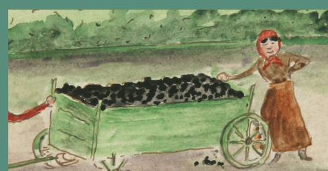
Uhlí: cena 5Q / načerno 10Q