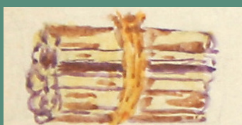
Dřevo: cena 4Q / načerno 8Q