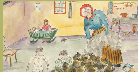
Řepa: cena 2Q / načerno 4Q